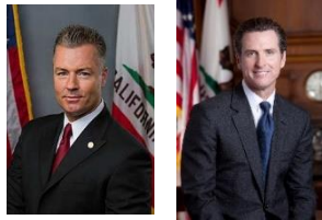
Antonio Villaraigosa, Delaine Eastin, John Chiang, Travis Allen, Gavin Newsom